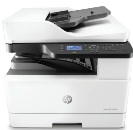
Πολυλειτουργικός εκτυπωτής HP LaserJet M436nda

Βασιστείτε στην αξιόπιστη και οικονομική εκτύπωση του πολυλειτουργικού εκτυπωτή σε A3 για να διευρύνετε τις δυνατότητές σας. Απλοποιήστε τις ροές εργασιών με λύσεις για την αποδοτική σάρωση και αντιγραφή και απολαύστε τις δυνατότητες δικτύωσης καθώς και την απομακρυσμένη παρακολούθηση. 1 Εξοικονομήστε πόρους και χρόνο με τις αυτόματες δυνατότητες χειρισμού χαρτιού. 2,3