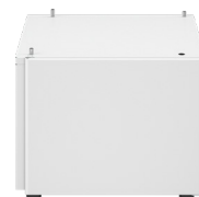
ΑΠΛΗ ΒΑΣΗ ΤΥΠΟΥ J-2