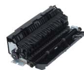
Μονάδα διπλής όψης-Ε1